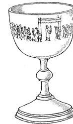
Die Fronleichnamsprozession ermutigt uns, im Alltag in den Prozess der Liebe Jesu einzutreten.